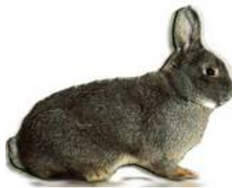
Blaue Wiener .

Simon Trellert, Spielstrasse 7, 39167 Groß Rodensleben